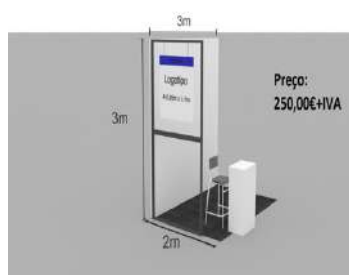
Stand 1 – WALL €250,00+ IVA

Estão disponíveis 3 soluções para participar como expositor na 22ª Feira: